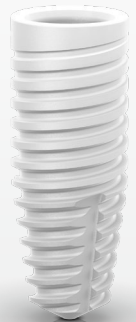
Instalação do implante