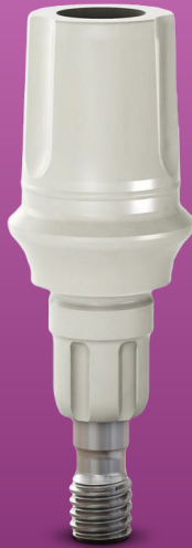
Próteses provisória unitária cimentada