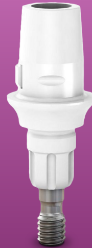
Próteses unitária parafusada