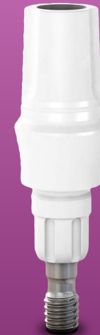
Próteses unitária cimentadas