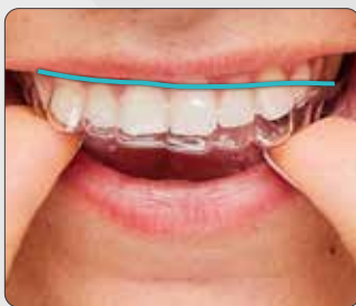
Design ClearCorrect Haute et Plate

Il est prouvé que notre design unique aide votre orthodontiste à mieux contrôler la façon dont vos dents bougent pendant le traitement 4 , ce qui vous aidera tous les deux à atteindre vos objectifs.