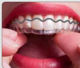
Design de la concurrence Festonnée