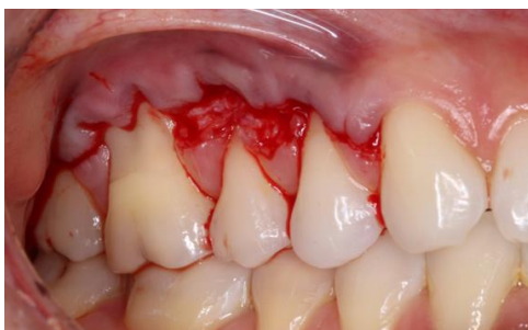
Incisões do retalho deslocado coronal para técnicas de retrações múltiplas de Zucchelli e De Sanctis (2000).