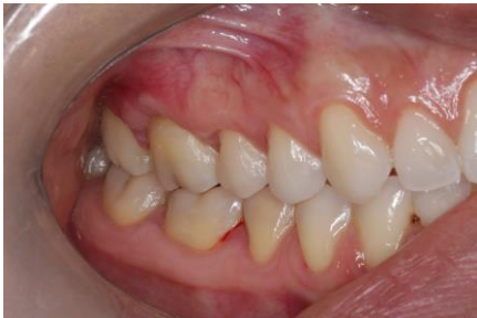
Pós-operatório de 18 meses visão direta