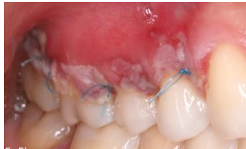
Pós-operatório de 8 dias