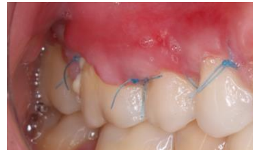
Pós-operatório de 15 dias