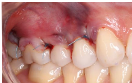
Sutura suspensória realizada