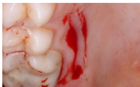
Enxerto delimitado para remoção