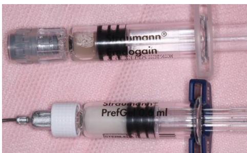
PrefGel e Emdogain®