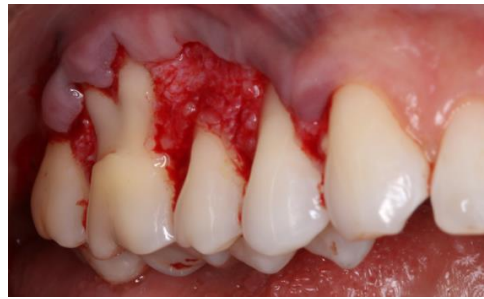
Superfícies tratadas com Emdogain®.