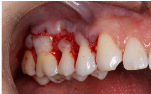
Superfícies tratadas com PrefGel por 2 minutos