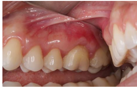
Pós-operatório de 18 meses visão indireta