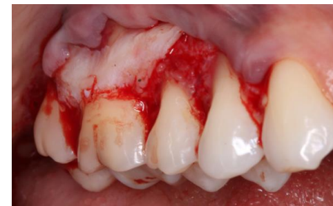
Enxerto conjuntivo posicionado