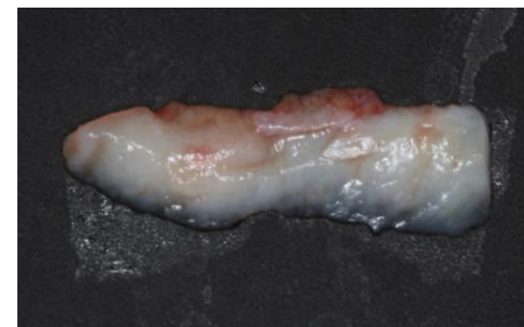
Enxerto removido do palato