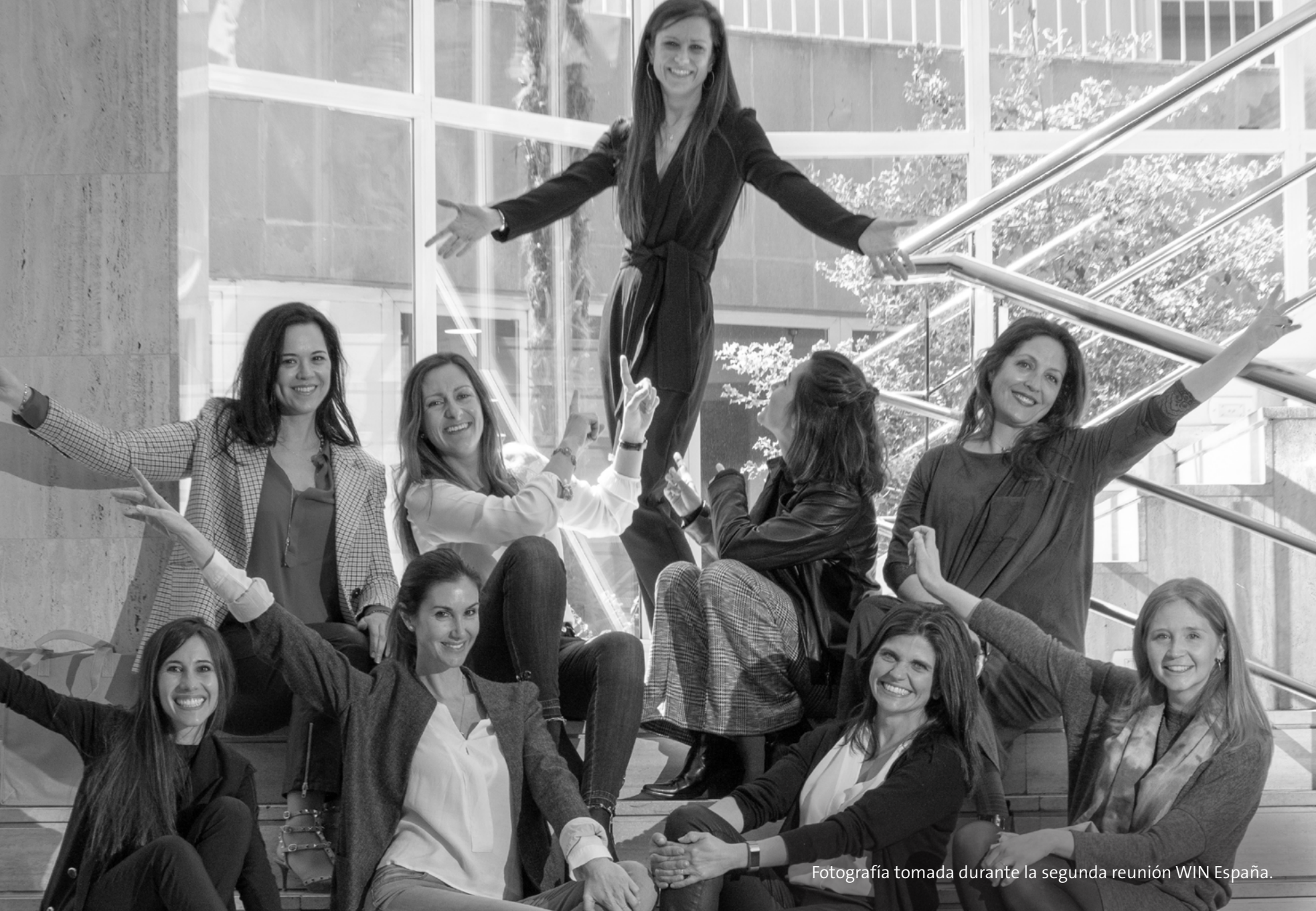
Fotografía tomada durante la segunda reunión WIN España.