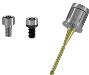
Instrument sphérique Anthogyr